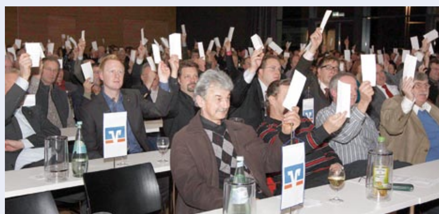
Das höchste Gremium der Volksbank Bitburg eG, die Vertreterversammlung, entscheidet über das abgelaufene Geschäftsjahr.